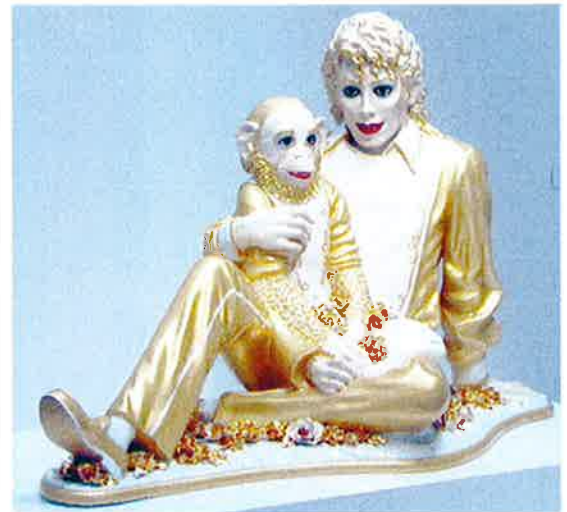
Jeff Koons «Michael Jackson and Bubbles» (1988)