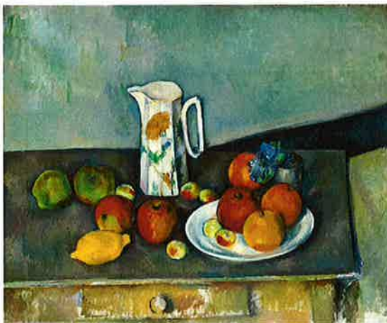
Paul Cezanne «Nature Morte» (1886)