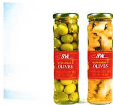
Morten Viskum: «Olivenglass med mus» (1995)