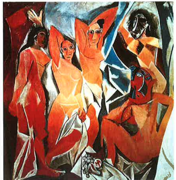
Pablo Picasso «Pikene fra Avignon» (Les Demoiselles d'Avignon) (1907)