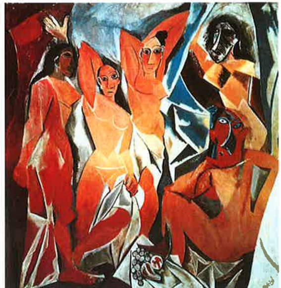
Pablo Picasso «Pikene fra Avignon» (Les Demoiselles d'Avignon) (1907)