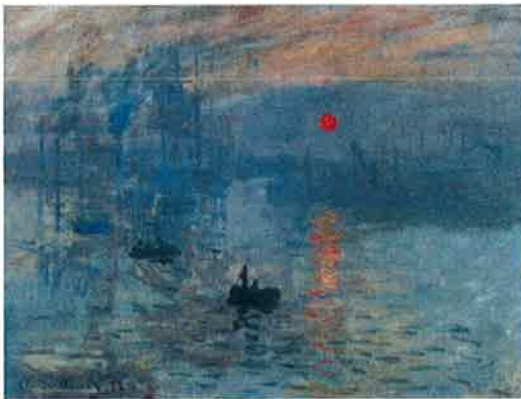
Claude Monet: «Soloppgang» (1872).

Dernest vel du eit kunstverk frå kvar ramme (til saman to verk) og karakteriser desse. Drøft likskap og ulikskap mellom dei, og i kva grad dei stadfestar påstanden over.