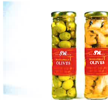
Morten Viskum: «Olivenglass med mus» (1995)