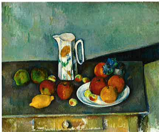
Paul Cezanne «Nature Morte» (1886)