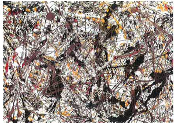
Jackson Pollock: «Sølv og svart, med gult og rødt» (1948).