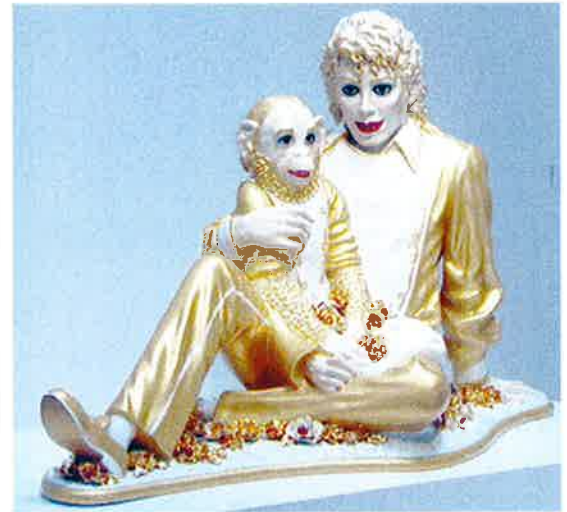
Jeff Koons «Michael Jackson and Bubbles» (1988)