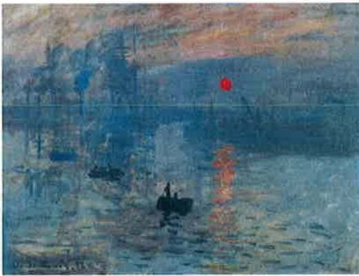
Claude Monet: «Soloppgang» (1872).

Velg deretter et kunstverk fra hver ramme (til sammen to verk) og beskriv disse. Drøft likheter og ulikheter mellom dem, og i hvilken grad de bekrefter påstanden over.