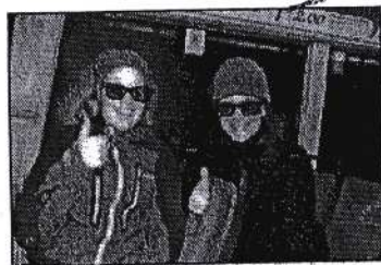
16 Jentene er svært fornøgte med filmen og gjev den tommel opp med 3D briller på!