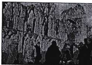
Guiden kons foran klassa.