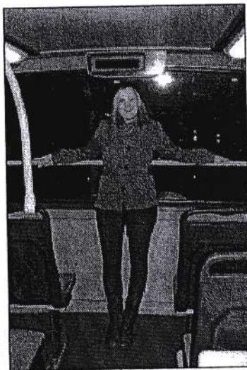
14 Photoshoot på dobbeldekker bussen!