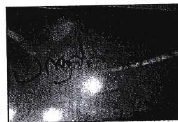
Ingebjørg was here!