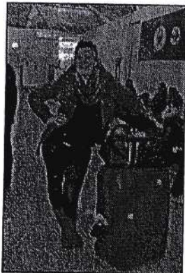
22 Trøtt eller? nei da.

Men her er nokon bilder som du kan sjå på mens du ler av dumheten min =)