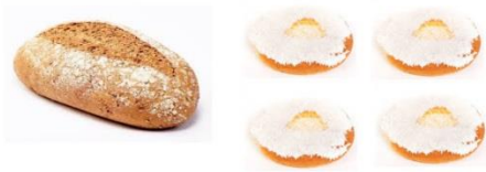
Varene til Ida sin pappa